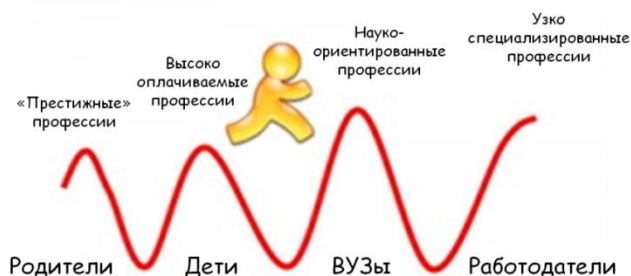
Рис.1. Потребности и ожидания в сфере будущей профессии

Сейчас профориентационной деятельностью занимаются все заинтересованные стороны и школа, и ВУЗы, и работодатели, и родители, конечно же, тоже. Однако, как видно из рисунка ниже, цели у всех разные.