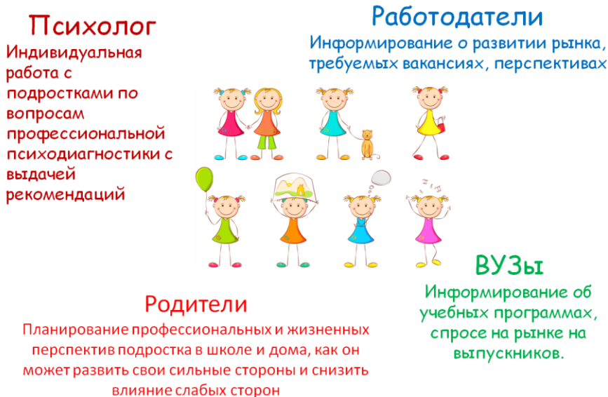
Рис. 2. Заинтересованные участники профориентационной деятельности

Главная цель создаваемой группы - постепенное формирование у подростка внутренней готовности самостоятельно и осознанно планировать, корректировать и реализовывать перспективы своего развития (профессионального, жизненного и личностного плана).